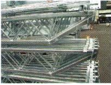
Kuumasinkittyjä kattoristikkoita. Rajoitettu piipitoisuus.