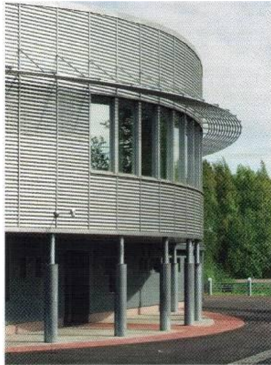
Vähäiset värierot voivat elävöittää julkisivua.