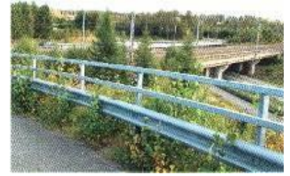
Noin 15 vuotta käytössä olleet teräsrakenteet.