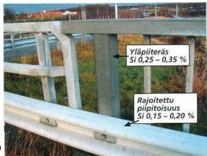
15 vuotta käytössä olleet siltarakenteet.

Teräsrakenteet ovat maalattavissa sinkityksen jälkeen, mutta hyvä pinnan laatu on vaikeampi saavuttaa kuin alapiiteräksillä. Fosforin (P) vähäisellä määrällä ei ole vaikutusta keskiapiiterästen sinkitykseen.