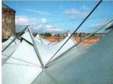
Kuumasinkittyjä kattorakenteita kulttuuri rakennuksessa.